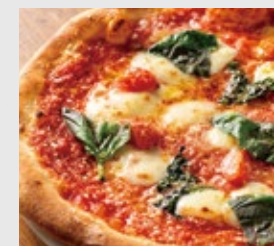
マルゲリータ・エクストラ 水牛モッツアレラチーズ