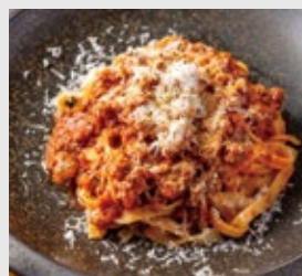
自家製ボロネーゼ フェットチーネ