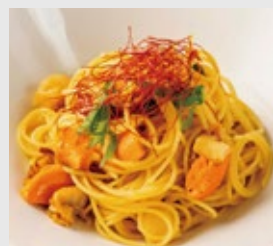
ホタテとドライマトの 和風ペペロンチーノ