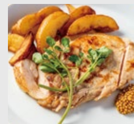
山形三元豚のグリル +500