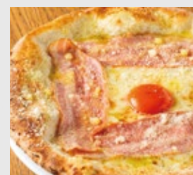
ピッツァ カルボナーラ