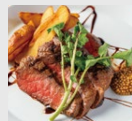
霧峰牛もも肉のグリル +1000