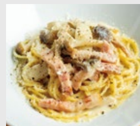
ポルチーニと色々キノコ、 ベーコンのクリームソース