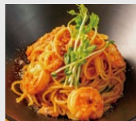
ハーブ海老とツナの オーガニックマトソース