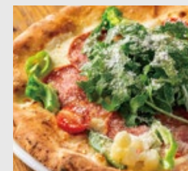
農園野菜とサラミ ロzzo or ピアッコ