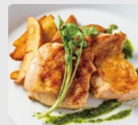
大山どりもも肉のグリル +300