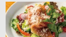
生ハムと農園野菜の シーザーサラダ 自家製シーザードレッシング