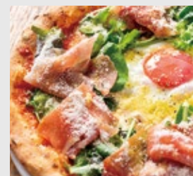
生ハムと蘭王卵 ロzzo or ピアッコ