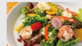
ハーブ海老と彩り野菜の グリーンサラダ りんごの発酵ドレッシング