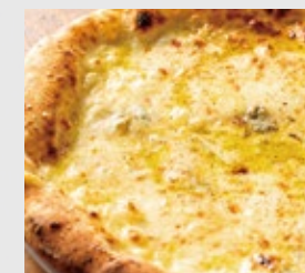
クアトロフォルマッジ カマンベール or ゴルゴンゾーラ