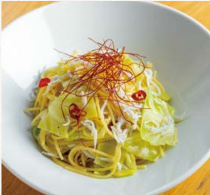
和歌山県産しらすと 春キャベツのペペロンチーノ

BUFFET + PASTA + FREE DRINK ..... ALL 1890