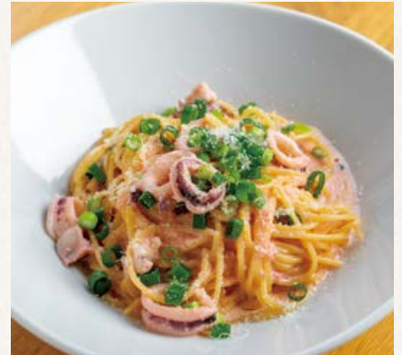
ヤリイカと博多明太子の クリームソース