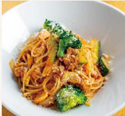
彩り野菜とサルシッチャの 菜園風ソース