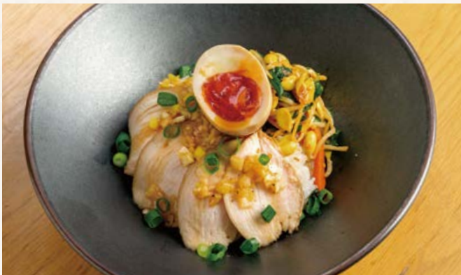
自家製大山どりチャーシュー丼 ..... 1690