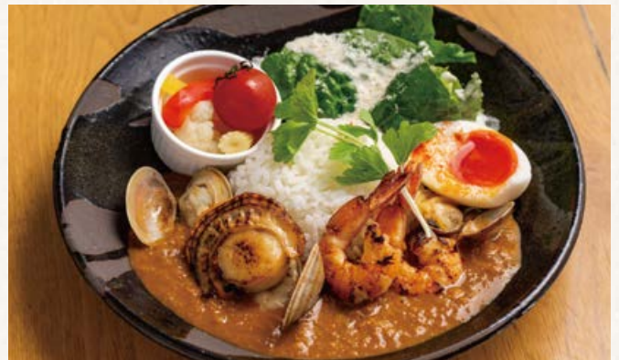
muse 特製 海の幸のスパイシーカレー ..... 1890