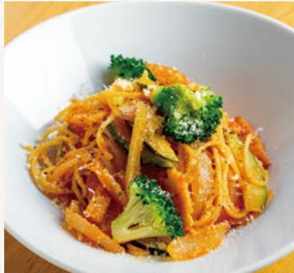
彩り野菜とベーコンの 菜園風ソース