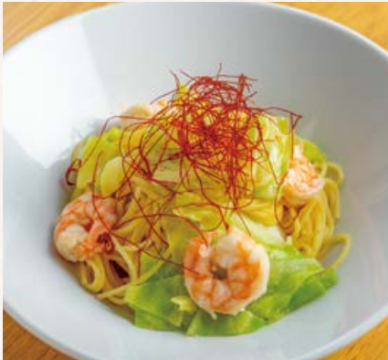
ハーブ海老と春キャベツの ペペロンチーノ

BUFFET + PASTA + FREE DRINK ..... ALL 1890