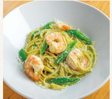
ハーブ海老とスナップエンドウの バジルクリームソース